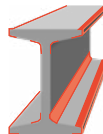
Figura 1. Ejemplo lectura

Por regla general no se realizarán lecturas en las zonas donde no se pueda garantizar la correcta lectura del equipo (alas estrechas, intersecciones, etc.). Por regla general las mediciones se efectuarán al menos a 25 mm de los bordes, de las esquinas y de las intersecciones de la estructura. (ver figura 1).